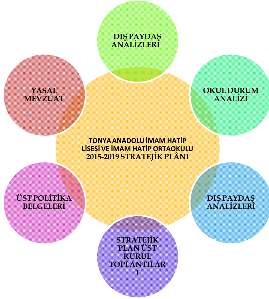
Őekil 2: Stratejik Plan Hazırlık Çalışmaları

tamamlanması, üst kurula belirli dönemlerde rapor sunmak ve üst kurulun önerileri doğrultusunda gerekli çalışmaları yürütmek üzere “Okul Stratejik Plan Ekibi” oluşturulmuştur.